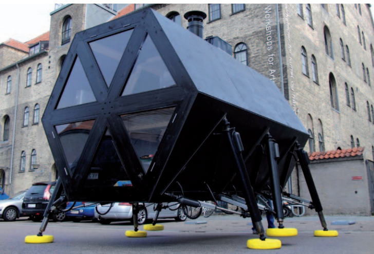
"WALKING HOUSE" DER KÜNSTLERGRUPPE N55