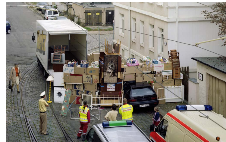
PETER BUX: DOKUMENTATION DER ARBEIT „UMZUGSBURG“, 2007. © GUNTER BINSACK.