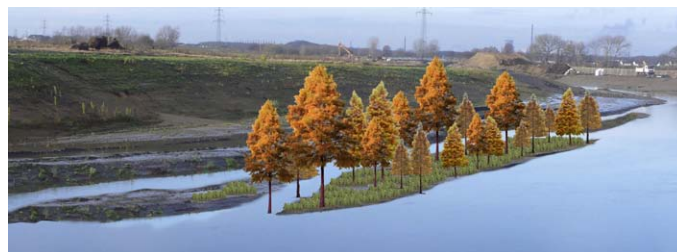
"LANDSCHAFT IM FLUSS", ENTWURF VON THOMAS STRICKER.